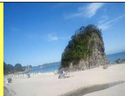
風光明媚な吉佐美大浜☆