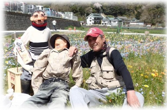
「鬼ごろし」を抱えた酒飲み人形に迎えられて記念撮影 (2018.3.30 松崎花畑)

ながら飲んでいると、睡魔が来たようだ、我が家のお湯割りワクチンは効くのが早い、さようなら 又お会いしましょう。 令和3年2月19日(金)