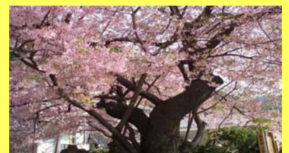
早咲きの河津桜を愛でにお越しください。